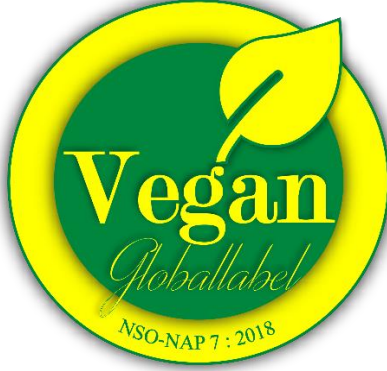
Sertifika No: XXXXYZ Şekil 7: Yeşil-Sarı Alternatif Logo