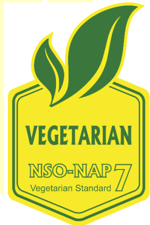
Certificate No: Certificate No: XXXXYZ Şekil 4: Sarı-Yeşil Logo