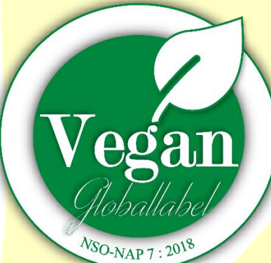
Sertifika No: XXXXYZ Şekil 9: Yeşil-Beyaz Alternatif Logo