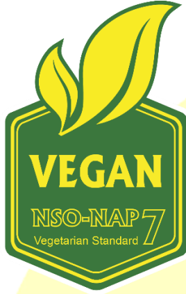
Certificate No: XXXXYZ Şekil 2: Yeşil-Sarı Logo