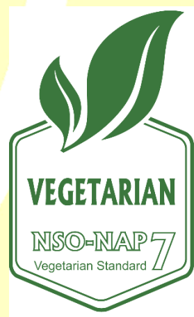
Certificate No: Certificate No: XXXXYZ Şekil 6: Yeşil-Beyaz Logo