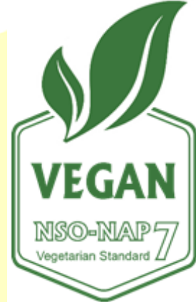
Certificate No: XXXXYZ Şekil 3: Yeşil-Beyaz Logo