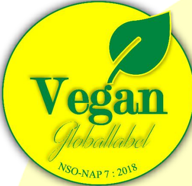
Sertifika No: XXXXYZ Şekil 8: Sarı-Yeşil Alternatif Logo