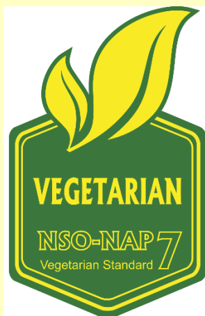
Certificate No: Certificate No: XXXXYZ Şekil 5: Yeşil-Sarı Logo