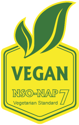
Certificate No: XXXXYZ Şekil 1: Sarı-Yeşil Logo

3.16 Logo / Lisans / İşaret / Sembol / Marka / Etiket Formasyonu örnekleri aşağıda belirtildiği gibidir.